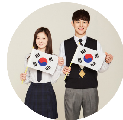
대한민국 대표 도시 송파 대한민국의 대표 도시로써 나라사랑 선도