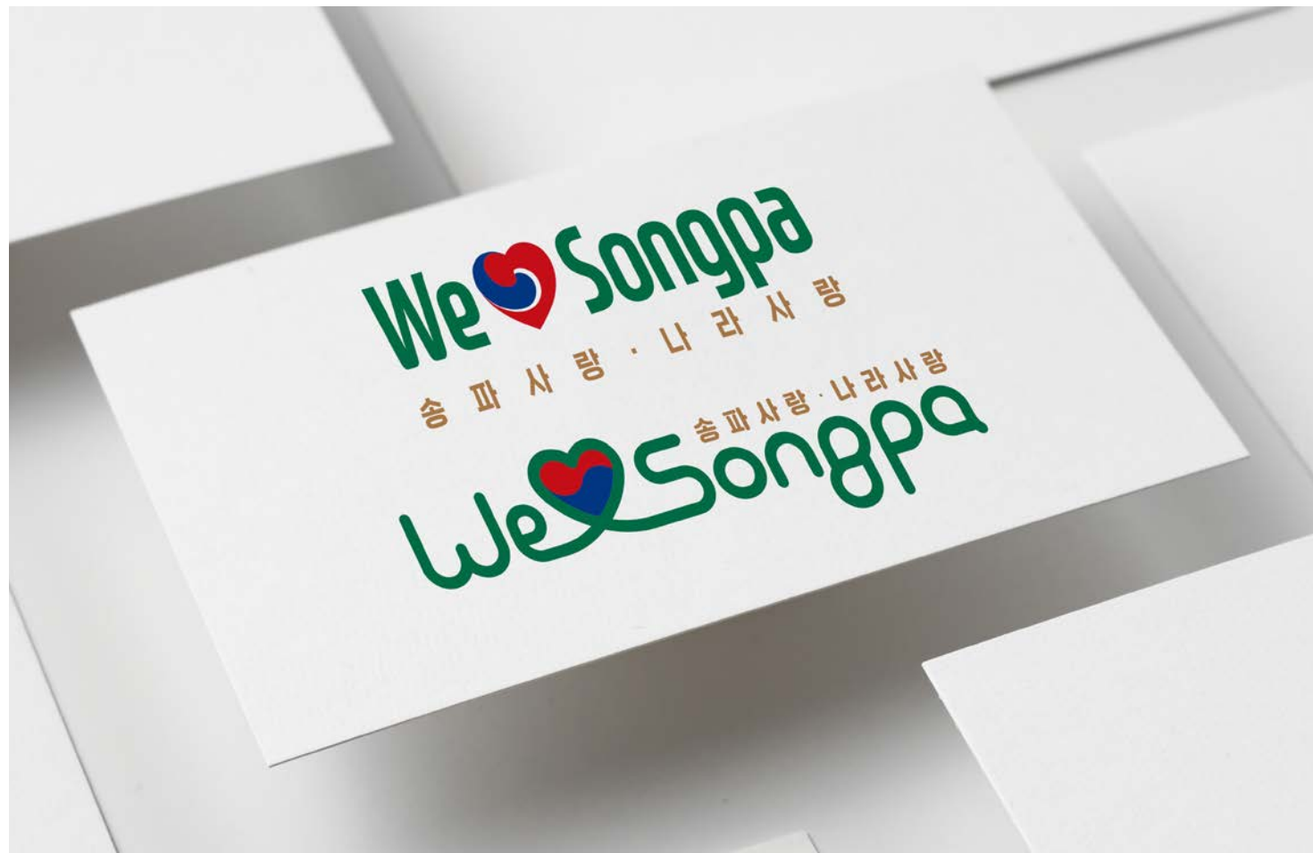
홍보물 활용예시 A