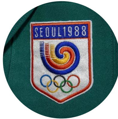
88 서울올림픽 개최 대한민국의 국민을 하나로 모았던 88올림픽 개최 도시의 역사적 배경