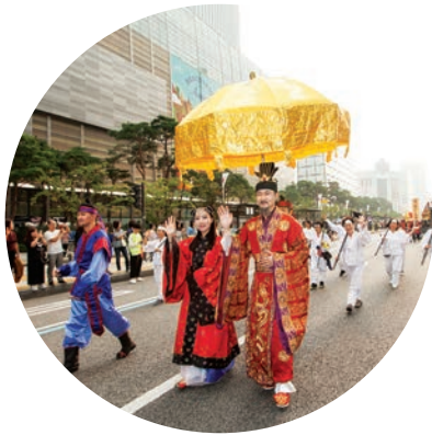
한성백제 수도 고대국가 백제의 땅으로 서울의 역사가 시작한 곳