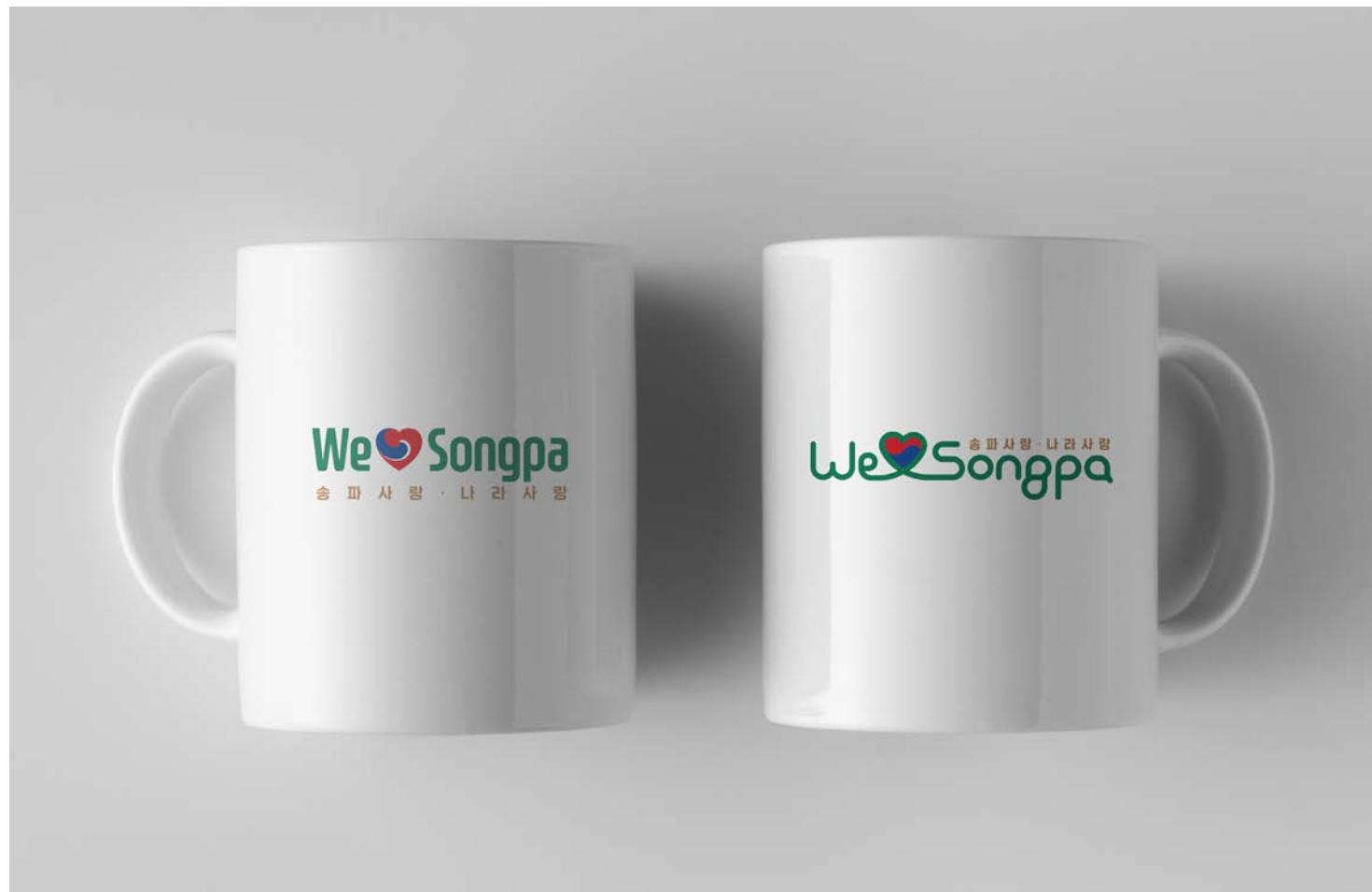
홍보물 활용예시 B